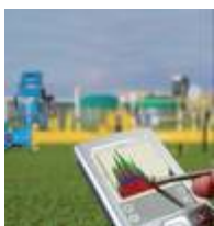
MDE900 Mobile Datenerfassung mit MDE900