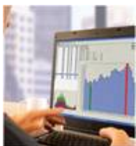
WICO22 Datenfernauslesung mit WICO22

Für die notwendigen Veränderungen bei der Abrechnungs- und Bilanzierungsvorbereitung bietet RMG ein Software- und Dienstleistungs-Portfolio, für die Beschaffung, Plausibilisierung und Distribution von Zähl-, Mess- und Energiewerten: