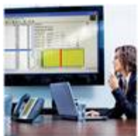
WEB Portal Darstellung von Energiedaten im Web Portal